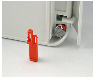
C6100006 Security plug PA 6 red