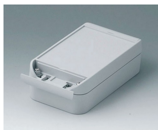
C6009161 SMART-BOX WIDTH 90 ASA+PC (UL 94 V-0) light grey RAL 7035 160x90x50mm IP 66