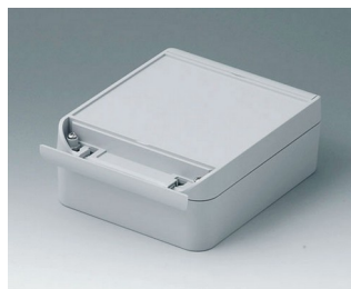
C6013161 SMART-BOX WIDTH 130 ASA+PC (UL 94 V-0) light grey RAL 7035 160x130x60mm IP 66