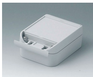
C6009121 SMART-BOX WIDTH 90 ASA+PC (UL 94 V-0) light grey RAL 7035 120x90x50mm IP 66