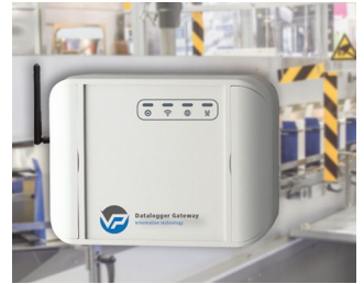
Data logger for machine monitoring