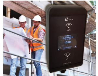
RFID card reader for construction site workers