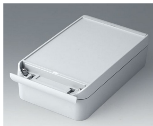
C6013221 SMART-BOX WIDTH 130 ASA+PC (UL 94 V-0) light grey RAL 7035 220x130x60mm IP 66