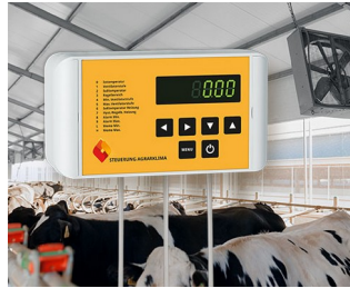
Agricultural climate Control