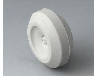
C2316147 Cable grommet TPE light grey RAL 7035 IP 67