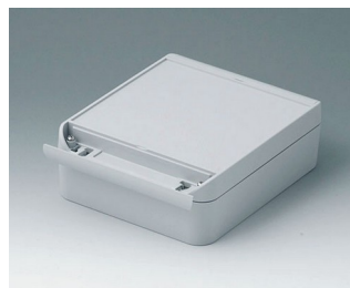
C6015181 SMART-BOX WIDTH 150 ASA+PC (UL 94 V-0) light grey RAL 7035 180x150x60mm IP 66