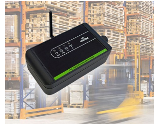
Pedestrian Alert System