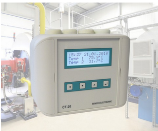
Universal temperature controller / Temperature difference controller