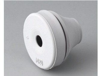
C2320137 Cable grommet EPDM light grey RAL 7035 IP 67