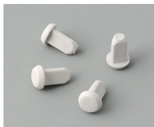
C2299018 Case feet TPE (UL 94 HB)