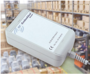
Active UHF RFID system

特别适用于强调外形设计的电气安装领域。例如用于取暖、通风和空调技术。控制技术。设备工程技术和安全技术等等。IoT/IIoT。Smart Factory。Industry 4.0。