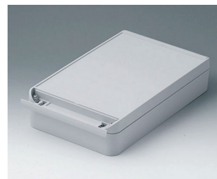
C6017281 SMART-BOX WIDTH 170 ASA+PC (UL 94 V-0) light grey RAL 7035 280x170x60mm IP 66