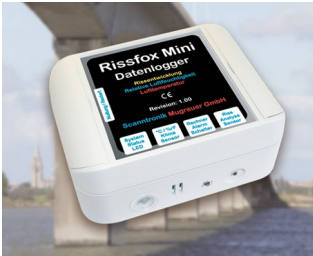
Miniature data logger for crack displacements and climatic data