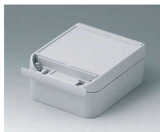
C6011141 SMART-BOX WIDTH 110 ASA+PC (UL 94 V-0) light grey RAL 7035 140x110x60mm IP 66