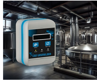
CO2 gas detector