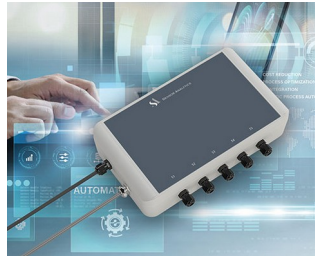
Multifunctional sensor housing