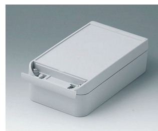
C6011201 SMART-BOX WIDTH 110 ASA+PC (UL 94 V-0) light grey RAL 7035 200x110x60mm IP 66