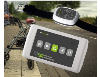
Dementia Protection System