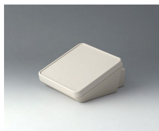
B4414307 PROTEC 140, Vers. III ASA+PC (UL 94 V-0) off-white RAL 9002 140x160x76mm IP 65 opt.