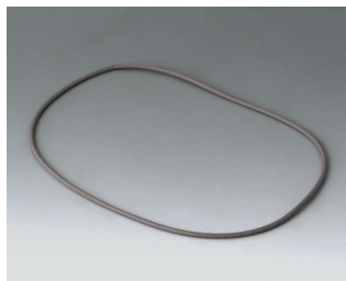
B4514030 Sealing 140