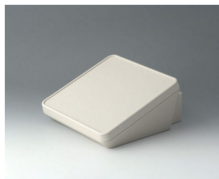
B4418307 PROTEC 180, Vers. III ASA+PC (UL 94 V-0) off-white RAL 9002 180x201x92mm IP 65 opt.