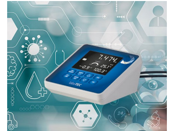
Laboratory measuring device