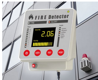
Terminal for fire alarm systems