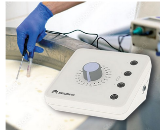
Simulator for testing measuring instruments