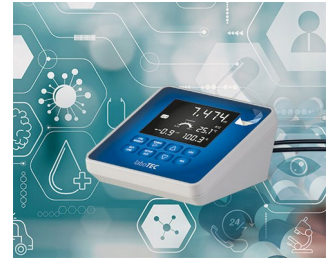
Laboratory measuring device