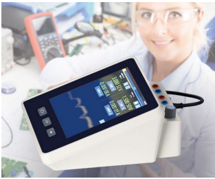
Multimeter measuring device