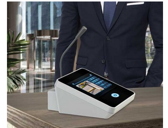
Table microphone / inter phone