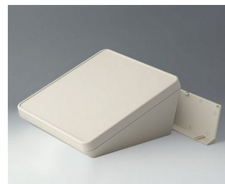
B4422207 PROTEC 220, Vers. II ASA+PC (UL 94 V-0) off-white RAL 9002 220x220x108mm IP 65 opt.