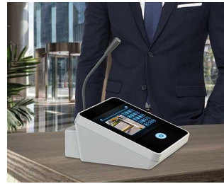
Table microphone / inter phone