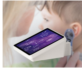
Hearing test device