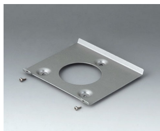
B4518101 Wall suspension element 180 Aluminium