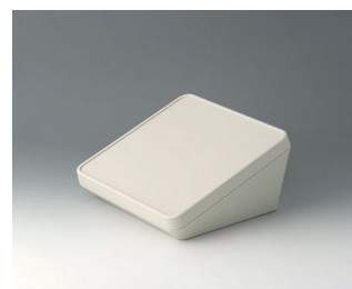
B4418107 PROTEC 180, Vers. I ASA+PC (UL 94 V-0) off-white RAL 9002 180x180x92mm IP 65 opt.