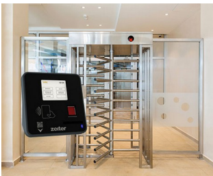
Terminal for access control