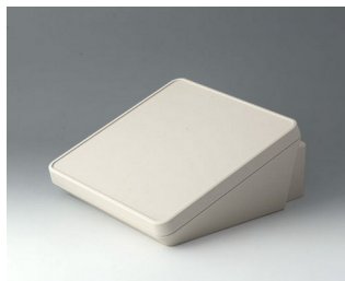
B4422307 PROTEC 220, Vers. III ASA+PC (UL 94 V-0) off-white RAL 9002 220x243x108mm IP 65 opt.