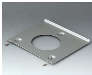
B4522101 Wall suspension element 220 Aluminium