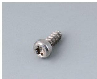
A0325060 Self-tapping screw 2.5 x 6 mm (T8) Stainless steel