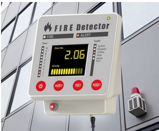
Terminal for fire alarm systems