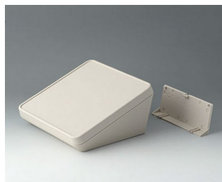
B4418207 PROTEC 180, Vers. II ASA+PC (UL 94 V-0) off-white RAL 9002 180x180x92mm IP 65 opt.