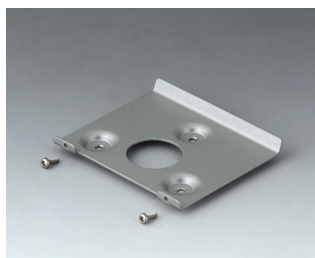
B4514101 Wall suspension element 140 Aluminium