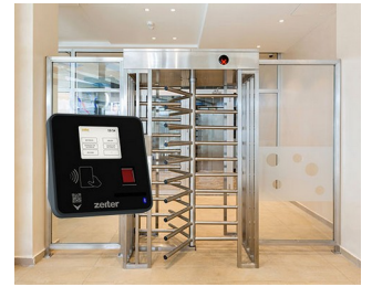
Terminal for access control