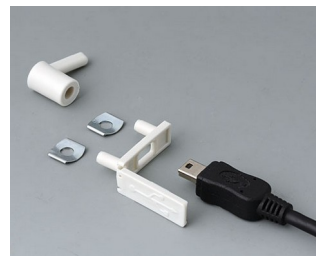
A9320207 USB cover, type Mini-USB PP off-white RAL 9002 29.5x8.5mm