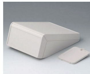
B4056227 UNITEC M, 1.4/0.6 ABS (UL 94 HB) off-white RAL 9002 148x210x80mm IP 40