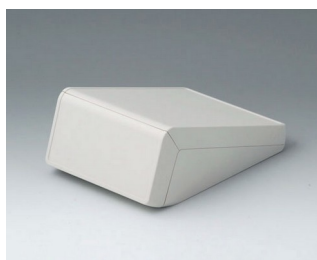
B4054107 UNITEC S, 0.6/0.6 ABS (UL 94 HB) off-white RAL 9002 125x177x69mm IP 40