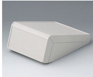
B4056117 UNITEC M, 1.4/1.4 ABS (UL 94 HB) off-white RAL 9002 148x210x80mm IP 40