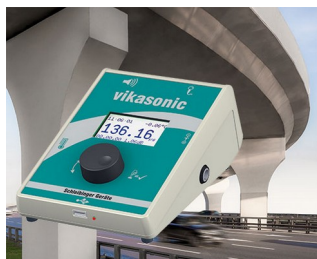
Ultrasonic measuring device