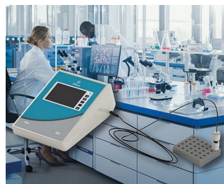
Measuring device for a research laboratory