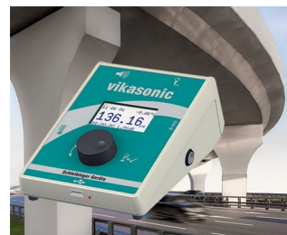
Ultrasonic measuring device