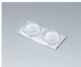
A9212330 Anti-slide feet 12 x 3.5 mm transparent