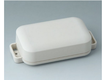
C3206207 EASYTEC 100 ASA+PC (UL 94 V-0) off-white RAL 9002 121x62x31mm IP 65 opt., IP 40