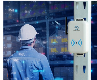
Smart store logistics