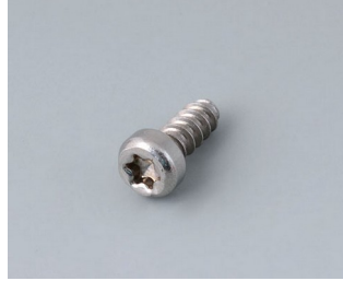
A0325060 Self-tapping screw 2.5 x 6 mm (T8) Stainless steel