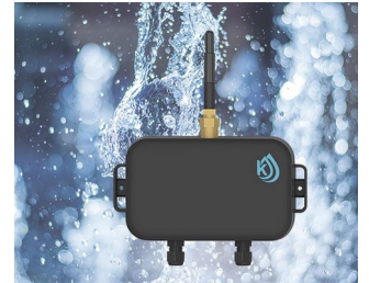
Water level monitoring