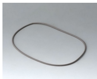
A9503030 Sealing 125