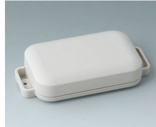
C3206107 EASYTEC 100 ASA+PC (UL 94 V-0) off-white RAL 9002 121x62x26mm IP 65 opt., IP 40