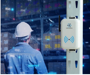
Smart store logistics