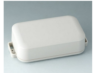
C3208207 EASYTEC 150 ASA+PC (UL 94 V-0) off-white RAL 9002 172x93x46mm IP 65 opt., IP 40