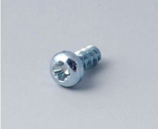
A0305031 Self-tapping screws 2.5 x 6 mm (PZ1)