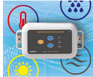
Data logger e.g. for temperature