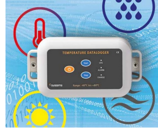
Data logger e.g. for temperature