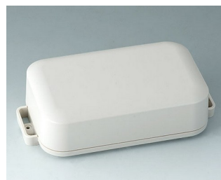
C3208207 EASYTEC 150 ASA+PC (UL 94 V-0) off-white RAL 9002 172x93x46mm IP 65 opt., IP 40