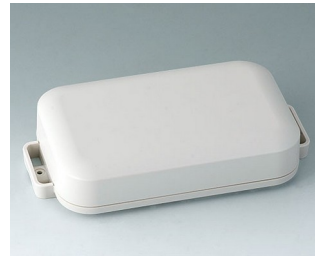
C3208107 EASYTEC 150 ASA+PC (UL 94 V-0) off-white RAL 9002 172x93x36mm IP 65 opt., IP 40