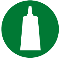
制备 / 组装