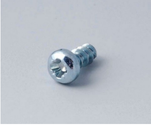
A0305031 Self-tapping screws 2.5 x 6 mm (PZ1)