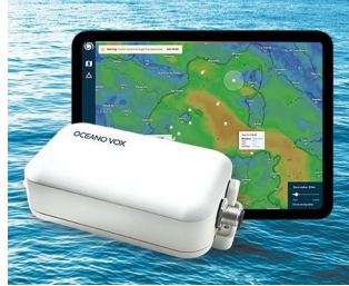
Data Collection for Ocean Observation network