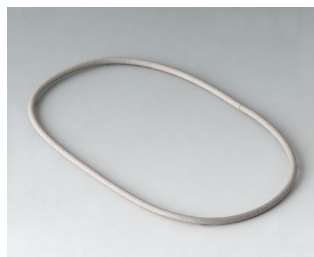
A9502030 Sealing 100