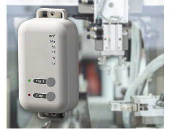
Data logger with gateway function