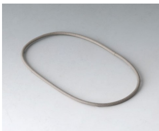
A9500030 Sealing 80