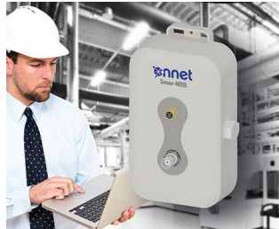
Sensor box for process monitoring