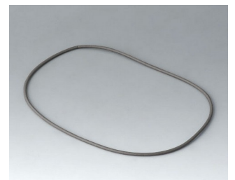
A9504030 Sealing 150