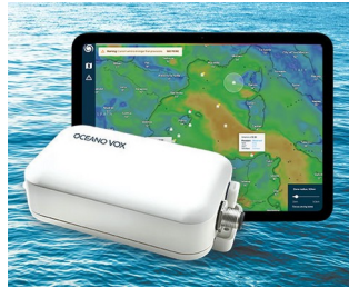
Data Collection for Ocean Observation network