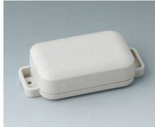
C3204207 EASYTEC 80 ASA+PC (UL 94 V-0) off-white RAL 9002 101x50x26mm IP 65 opt., IP 40