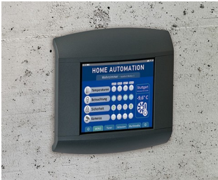
Control panel for home automation

计算机外围设备和数据技术领域。IoT/IIoT。工作岗位的数据收集系统。对讲和安全控制系统。进出口控制设备。测量和控制技术。实验室和医疗设施。