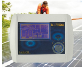
Control unit for photovoltaic solar installations