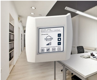
Indoor air quality control