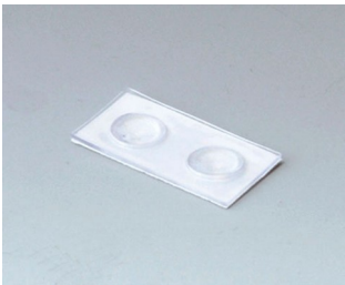
A9207150 Anti-slide feet 6.5 x 2 mm transparent