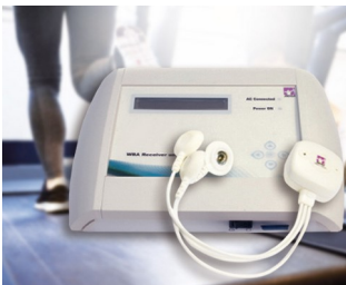
WBA receiver unit for measuring biosignals