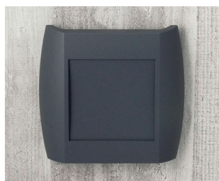
A9092108 DIATEC XS ABS (UL 94 HB) lava 150x37x155mm IP 40