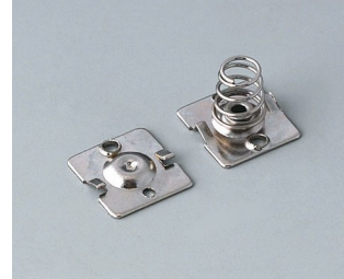
A9190015 Set of battery clips, 2 x AA Steel nickel-plated