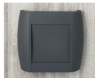
A9093108 DIATEC S ABS (UL 94 HB) lava 210x48x200mm IP 40