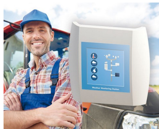
Weather Monitoring Station