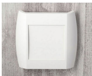
A9092107 DIATEC XS ABS (UL 94 HB) off-white RAL 9002 150x37x155mm IP 40