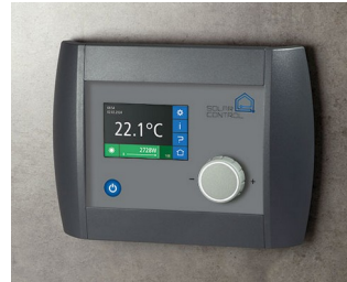
Solar Control Panel