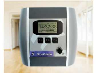
House control unit