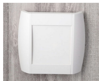
A9093107 DIATEC S ABS (UL 94 HB) off-white RAL 9002 210x48x200mm IP 40