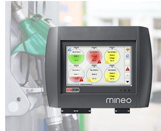
Controller for intelligent tank management