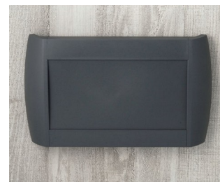
A9095108 DIATEC L ABS (UL 94 HB) lava 330x48x200mm IP 40