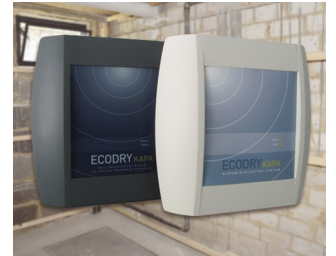
Systems for drying brickwork