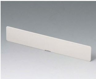
A9194007 Slot-in panel ABS (UL 94 HB) off-white RAL 9002 156x30x3mm