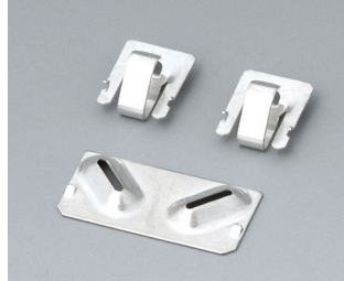
A9190002 Set of battery clips, 2xN/2xAA/2xAAA Steel tin-plated