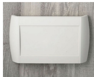
A9095107 DIATEC L ABS (UL 94 HB) off-white RAL 9002 330x48x200mm IP 40