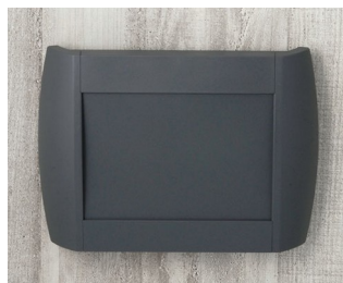
A9094108 DIATEC M ABS (UL 94 HB) lava 270x48x200mm IP 40