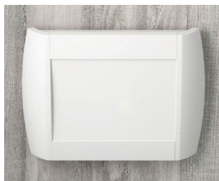
A9094107 DIATEC M ABS (UL 94 HB) off-white RAL 9002 270x48x200mm IP 40