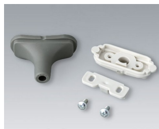
B2911328 Cable gland kit, 5.0 - 5.9 TPE volcano