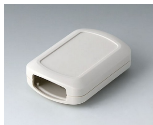
B2832107 CONNECT M ASA+PC (UL 94 V-0) off-white RAL 9002 76x54x22mm