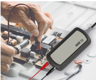
Test probe interface for PC applications