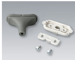
B2911308 Cable gland kit, 3.4 - 4.2 TPE volcano