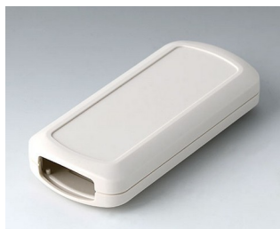
B2833107 CONNECT M ASA+PC (UL 94 V-0) off-white RAL 9002 116x54x22mm