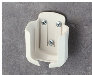
B2931507 Holder M ASA+PC (UL 94 V-0) off-white RAL 9002