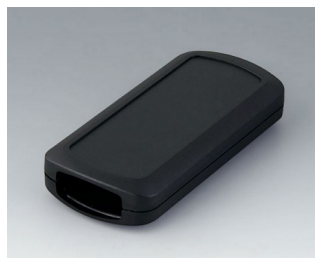
B2833109 CONNECT M ASA+PC (UL 94 V-0) black RAL 9005 116x54x22mm