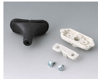
B2911309 Cable gland kit, 3.4 - 4.2 TPE black RAL 9005