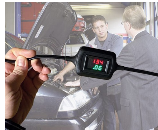
Voltage and current display during trickle charging