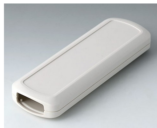
B2834107 CONNECT M ASA+PC (UL 94 V-0) off-white RAL 9002 156x54x22mm