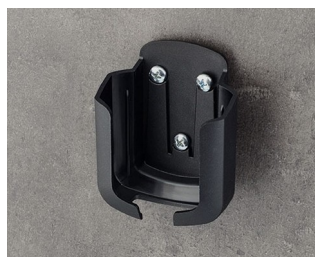
B2931509 Holder M ASA+PC (UL 94 V-0) black RAL 9005