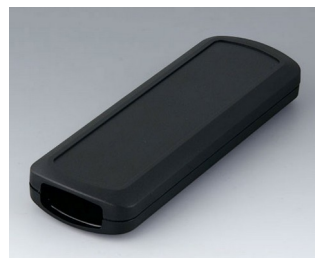
B2834109 CONNECT M ASA+PC (UL 94 V-0) black RAL 9005 156x54x22mm