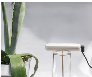
Tool for making colloidal silver solutions