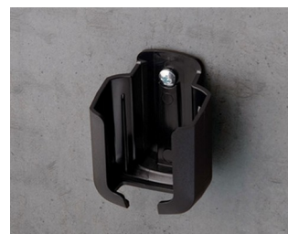
B2921509 Holder S ASA+PC (UL 94 V-0) black RAL 9005