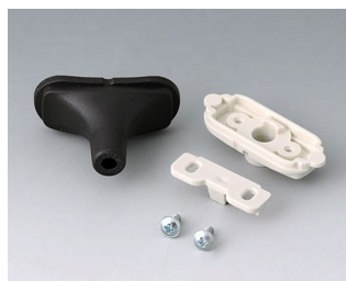
B2911319 Cable gland kit, 4.2 - 5.0 TPE black RAL 9005