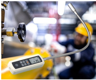
Gas leak detector

电脑配件。网络技术。建筑技术。安全技术。IoT/IIoT。医学和治疗应用。实验室用分析仪器。用于测量技术，包括带有检测探头的探测器、测试系统和测试仪器。环保技术用数据记录器。传感器技术。