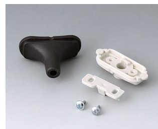
B2911329 Cable gland kit, 5.0 - 5.9 TPE black RAL 9005