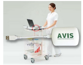
Receiver and data transfer for EMR