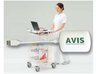
Receiver and data transfer for EMR