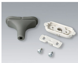
B2911318 Cable gland kit, 4.2 - 5.0 TPE volcano