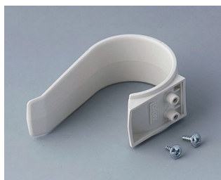
A9167027 Holding clamp PA 6 (UL 94 HB) off-white RAL 9002