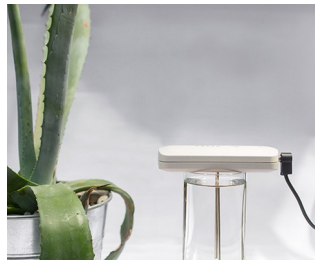
Tool for making colloidal silver solutions