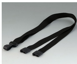
B9100073 Carrying strap, textile lanyard