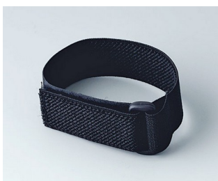
B9100033 Wrist strap