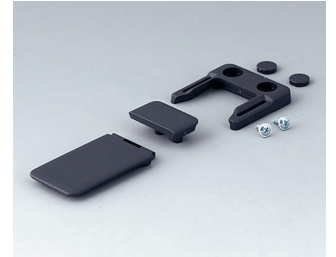
A9152048 Combi-Clip ABS (UL 94 HB) lava 45x27mm