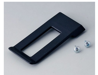
A9172109 Belt/Pocket clip ABS (UL 94 HB) black RAL 9005 62x30mm