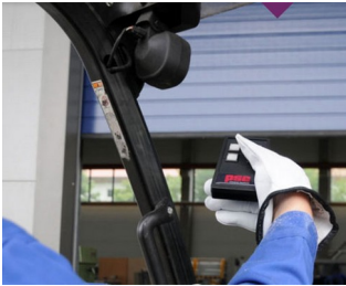
IR remote control for harsh environments

最理想用于脉冲发生器和接收器。适合用于测量和控制工程。用于超声和红外脉冲发生。各种遥控。无线通信。移动数据采集。