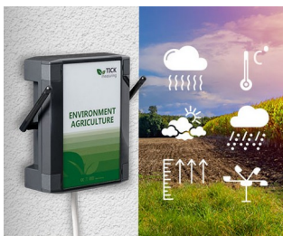
Weather station in agriculture