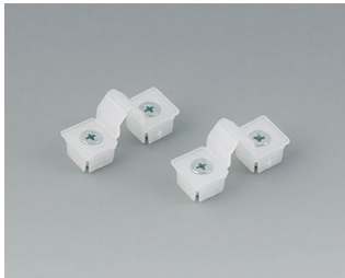
C2299031 Securing hinge for the cover PP natural-coloured