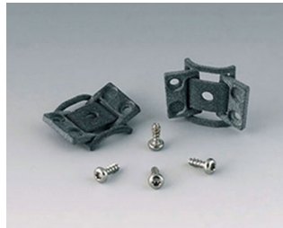
C8100360 Internal hinge set