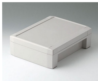
C8017222 SOLID-BOX 175 PC+ABS (UL 94 V-0) light grey RAL 7035 225x175x70mm IP 66, IP 67, IK 08