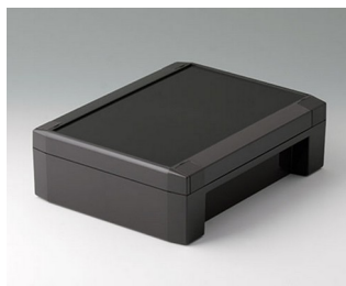
C8017221 SOLID-BOX 175 PC+ABS (UL 94 V-0) anthracite grey RAL 7016 225x175x70mm IP 66, IP 67, IK 08