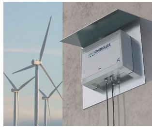
Controller wind turbines