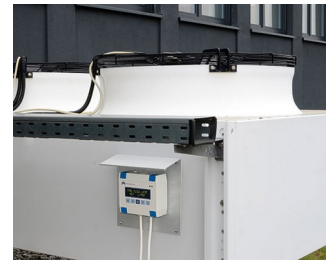
Heating/air conditioning/ventilation control