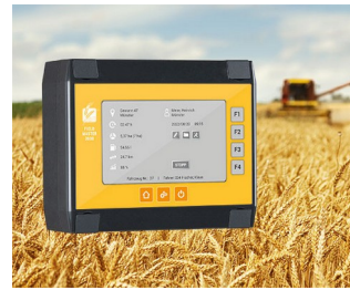
Data recording for harvesters